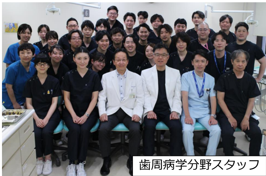
歯周病学分野スタッフ