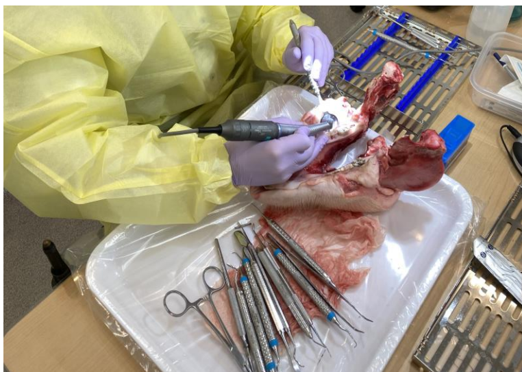
豚顎を用いた歯周外科実習

卒業後の進路は今後の歯科医師人生を大きく左右する重要な分岐点です。当分野で歯周治療の基本、高度な歯周外科治療、インプラント治療を含めた補綴治療および口腔機能回復治療をマスターしましょう！